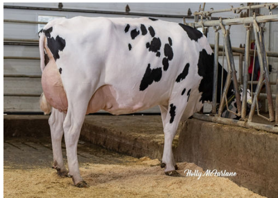
PROGENESIS JEDI MENACE GRANDDAM