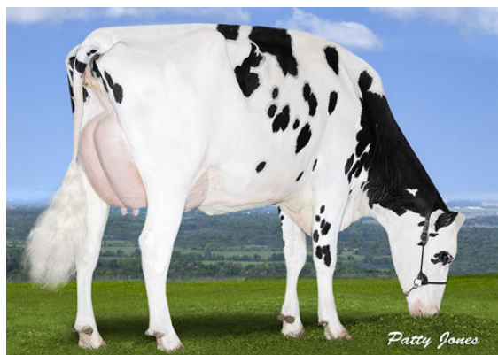
PEAK BOMBERO MAXIMA THIRD DAM